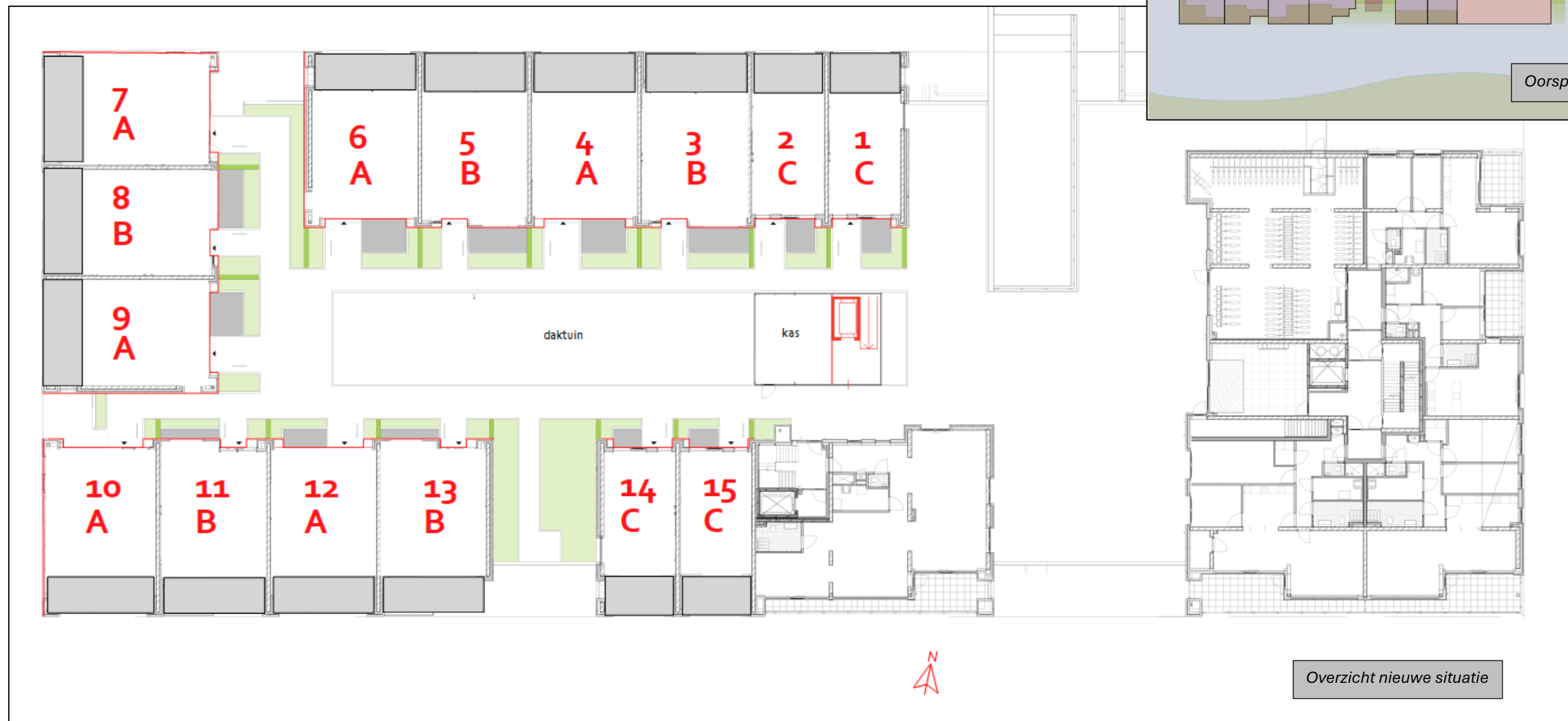
Overzicht nieuwe situatie